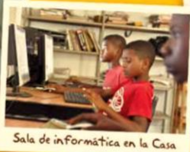
Sala de informática en la Casa