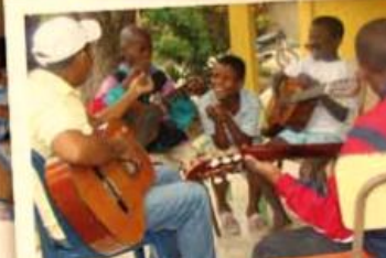
Gozando la clase de guitarra