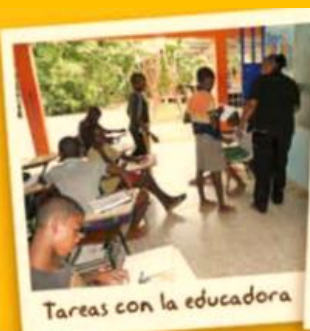
Tareas con la educadora