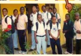
¡Listos para ir a la escuela!