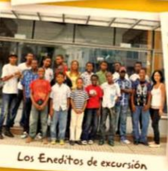
Los Eneditos de excursión