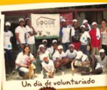
Un día de voluntariado